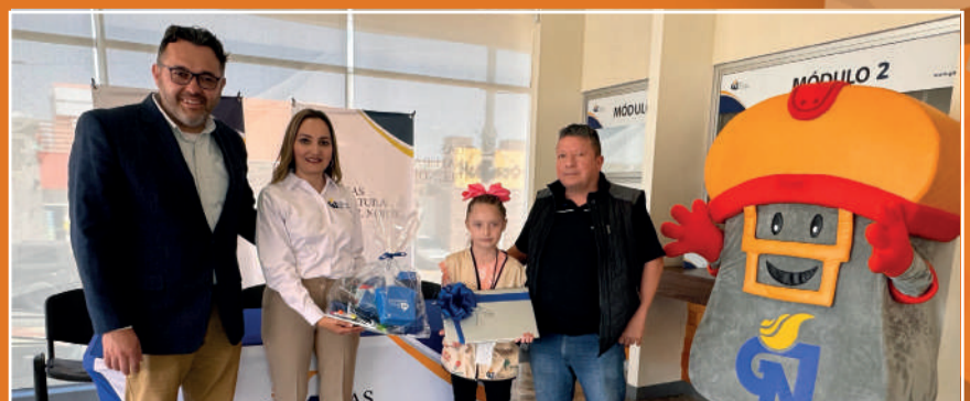
Por: Luis Baray