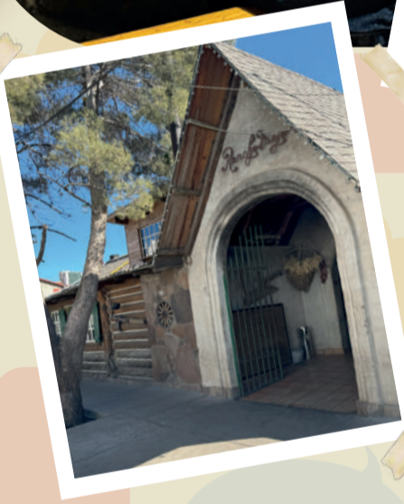
Por: Luis Baray