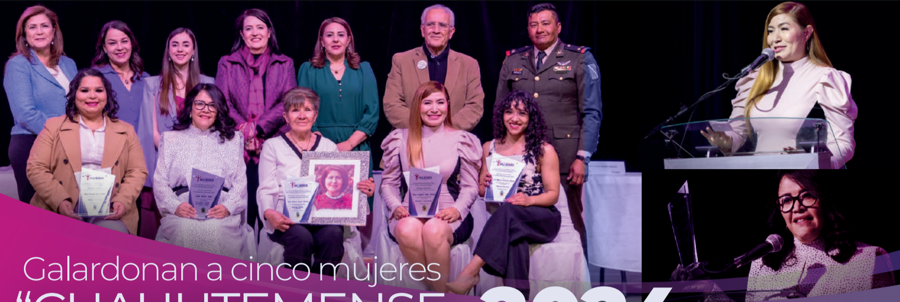
Por: Luis Baray